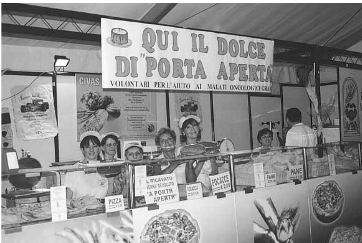
Fiera di Lainate