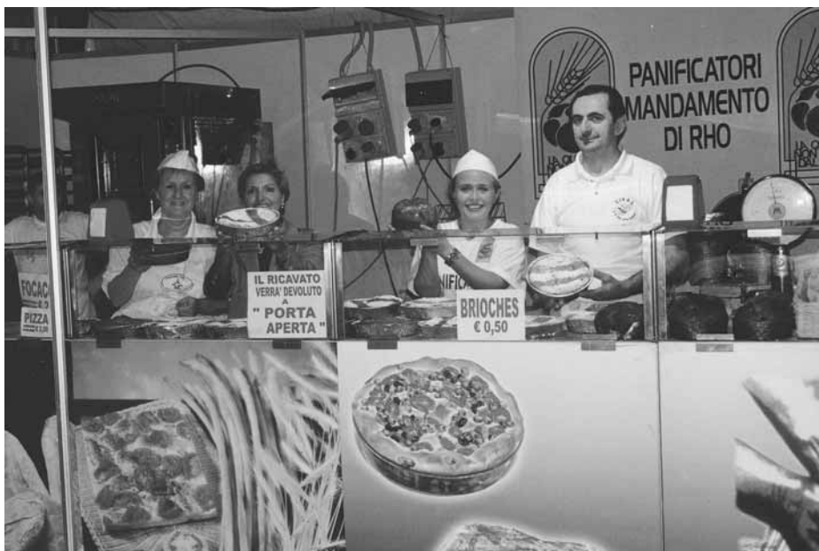
Fiera di Rho